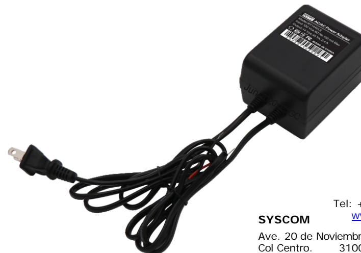
Foto del Transformador