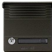
FOVO-BRO bronce oscuro