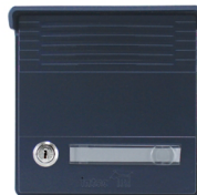
FOVO-AZU azul oscuro